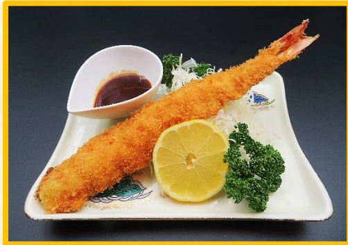
大海老フライ 2,550 円 (税込 2,805 円)