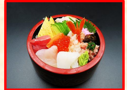
海鮮ちらし寿司 2,300 円 (税込 2,530 円)