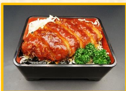
ソースかつ重 1,500 円 (税込 1,650 円)

お味噌汁 一杯 100 円 (税込 110 円) となります ご希望の方はお申し付けください