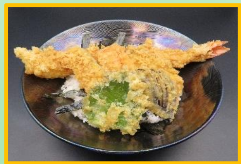
大海老天丼 2,750 円