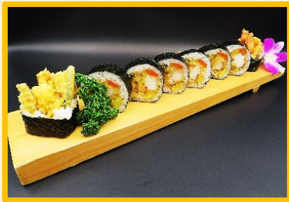
大海老野菜天むす