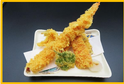
大海老天麩羅 2,650 円 (税込 2,915 円)