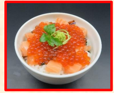
いくら親子丼 時 価

いくら丼 うに丼 サーモン丼等上記以外にもお好みでご注文承ります 内容量もお好みでご注文承ります