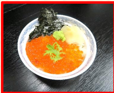
ミニいくら丼 時 価