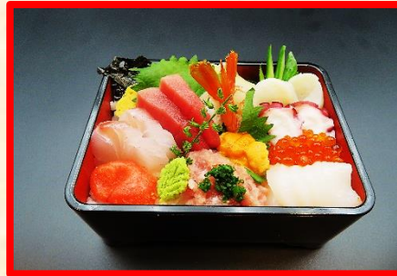
海鮮丼 4,300 円 (税込 4,730 円)