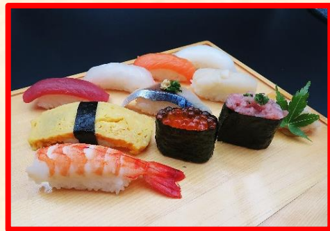
いさみの 得 寿司 10貫 2,500円 (税込2,750円)