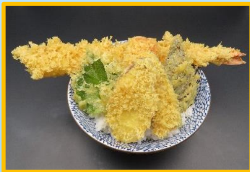
大海老天丼 2,750 円