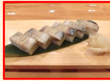
さばのバッテラ 1,600円