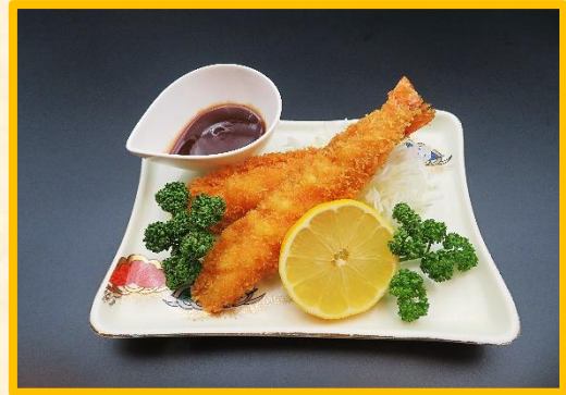
小海老フライ (海老 2 本) 1,750 円 (税込 1,925 円)