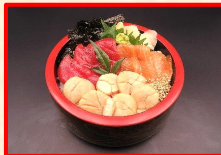
鮪・帆立・サーモン漬け丼 2,950 円 (税込 3,245 円)