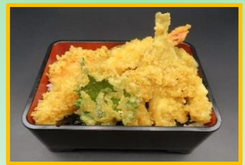
小海老天丼 1,650 円