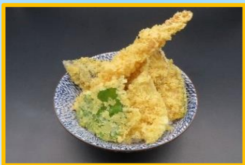
小海老天丼 1,650 円