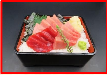
まぐろ丼 4,400 円 (税込 4,840 円)