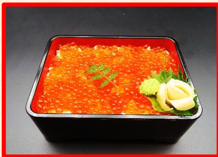
国産最高級 いくら丼 時 価