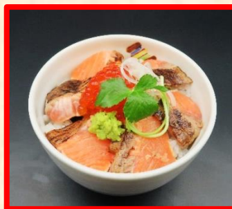
炙りサーモン丼 時 価