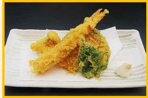
小海老天麩羅 1,550 円 (税込 1,705 円)