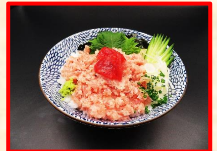
ねぎとろ丼 1,950 円 (税込 2,145 円)